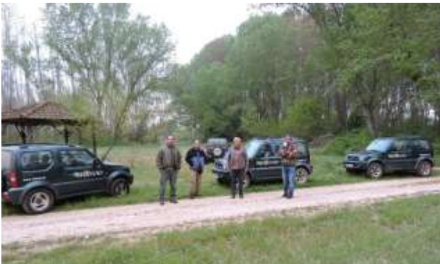
Εικόνα 4. Καταμετρήσεις φασιανών