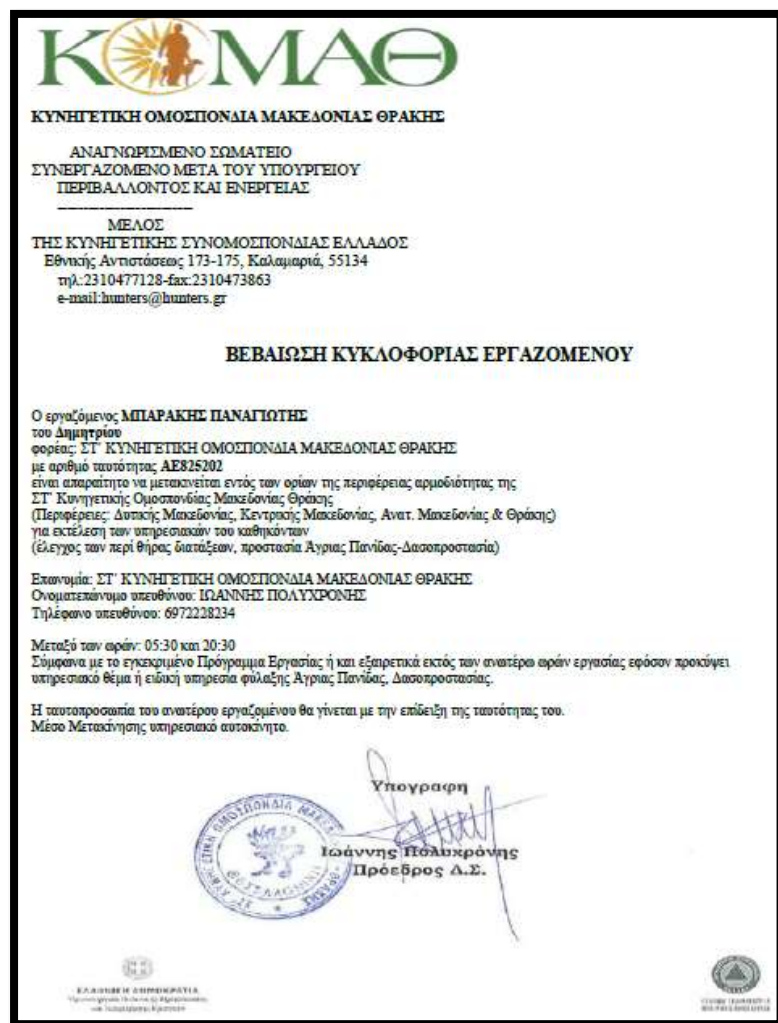
Εικόνα 1. Βεβαίωση για την εργασία θηροφυλάκων ΣΤ ΚΟΜΑΘ κατά την καραντίνα

Μετά την επιβολή πλήρους καραντίνας στις μετακινήσεις, οι οποίες για τους εργαζόμενους θα γίνονταν με την έκδοση βεβαίωσης του εργοδότη, η ΣΤ ΚΟΜΑΘ σε συνεργασία με τη Γενική Διεύθυνση Δασών και Δασικού Περιβάλλοντος του Υπουργείου Περιβάλλοντος και Ενέργειας έδωσε άμεσα την παρακάτω βεβαίωση σε κάθε θηροφύλακα.