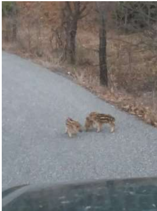
Νεαροί αγριόχοιροι κατά τη διάρκεια της περιπολίας (Φωτ. Σ. Λάλλος, 9/4/2020)

Οι θηροφύλακες μέσα στο δίμηνο καραντίνας ήταν συνεχώς στο δρόμο, με χιόνι, κρύο και ζέστη για να προσφέρουν φύλαξη υψηλής ποιότητας.