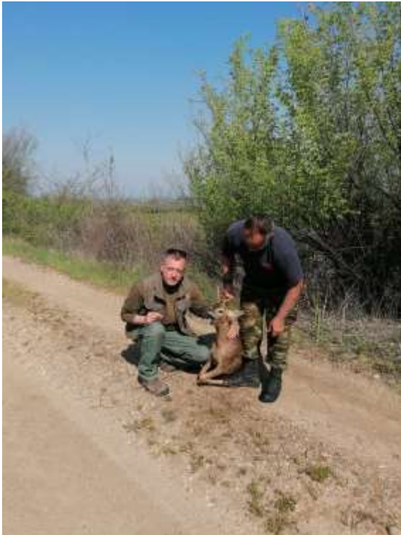
Εικόνα 3. Διάσωση ζαρκαδιού