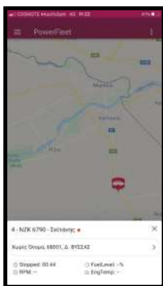
Εικόνα 7. Κίνηση οχήματος στο iPhone app για τη διάσωση του ζαρκαδιού