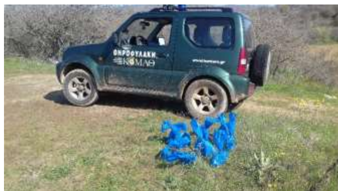
Εικόνα 2. Συλλογή δηλητηρίων